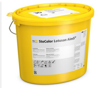
Peinture StoColor Lotusan AimS®