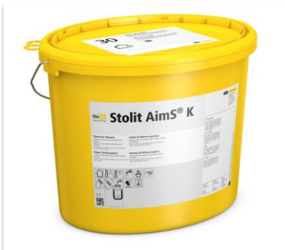
Enduit de finition Stolit AimS®