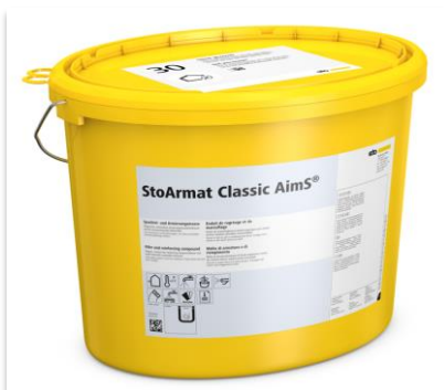
Sous-enduit StoArmat Classic AimS®