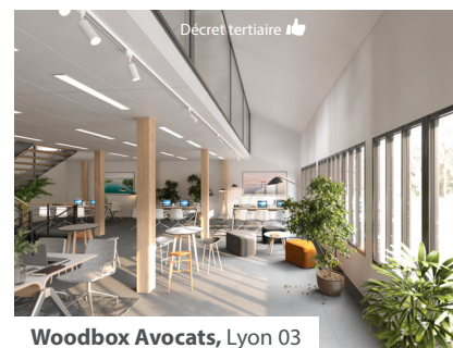
Woodbox Avocats, Lyon 03

Rénovation 100% biosourcée et hors site en coeur d'îlot urbain ; Gain -60% conso après travaux