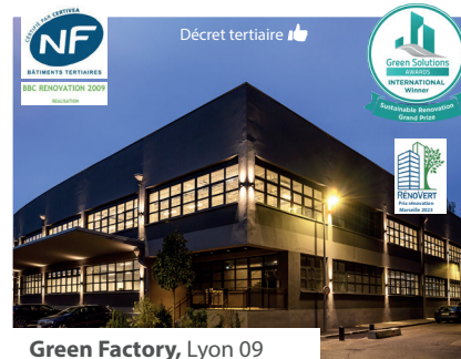
Green Factory, Lyon 09

Isolation biosourcée ; flexibilité ; Gain -60% conso après travaux ; système de pulseurs froid/chaud