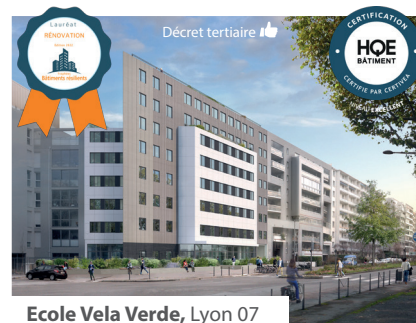
Ecole Vela Verde, Lyon 07

58 kWh/m 2 .an tous usages ; PAC décarbonnée ; stockage énergie ; auto-consommation PV