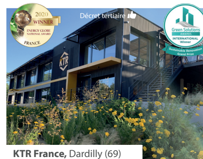
KTR France, Dardilly (69)

NOS RÉFÉRENCES EMBLÉMATIQUES DE RÉNOVATION GLOBALE